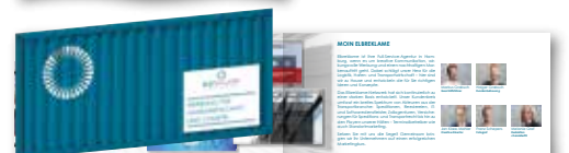
Beileger: lose beigelegt beispielsweise DIN-Lang, 6-Seiter (Spezifikationen auf Anfrage)