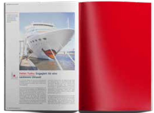
Anzeige 1/1 Seite 210 x 297 mm 3.000,00 EUR

Bankverbindung: Hamburger Sparkasse IBAN: DE88 2005 0550 1048 2156 59 BIC: HASPADEHXXX