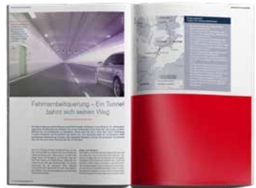
Anzeige 1/2 Seite 210 x 145 mm 1.700,00 EUR