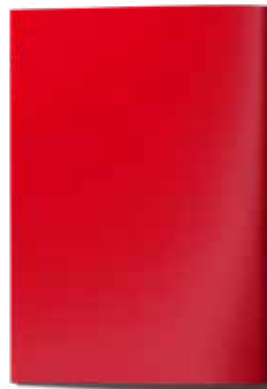
Anzeige 1/1 Seite U2/U3/U4 210 x 297 mm 4.500,00 EUR